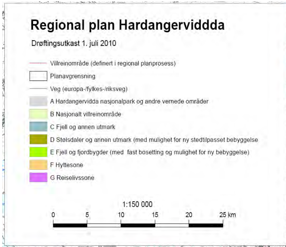
Figur: Utdrag, del av tittelfelt med sonekategorier i "Hardangervidda-planen"